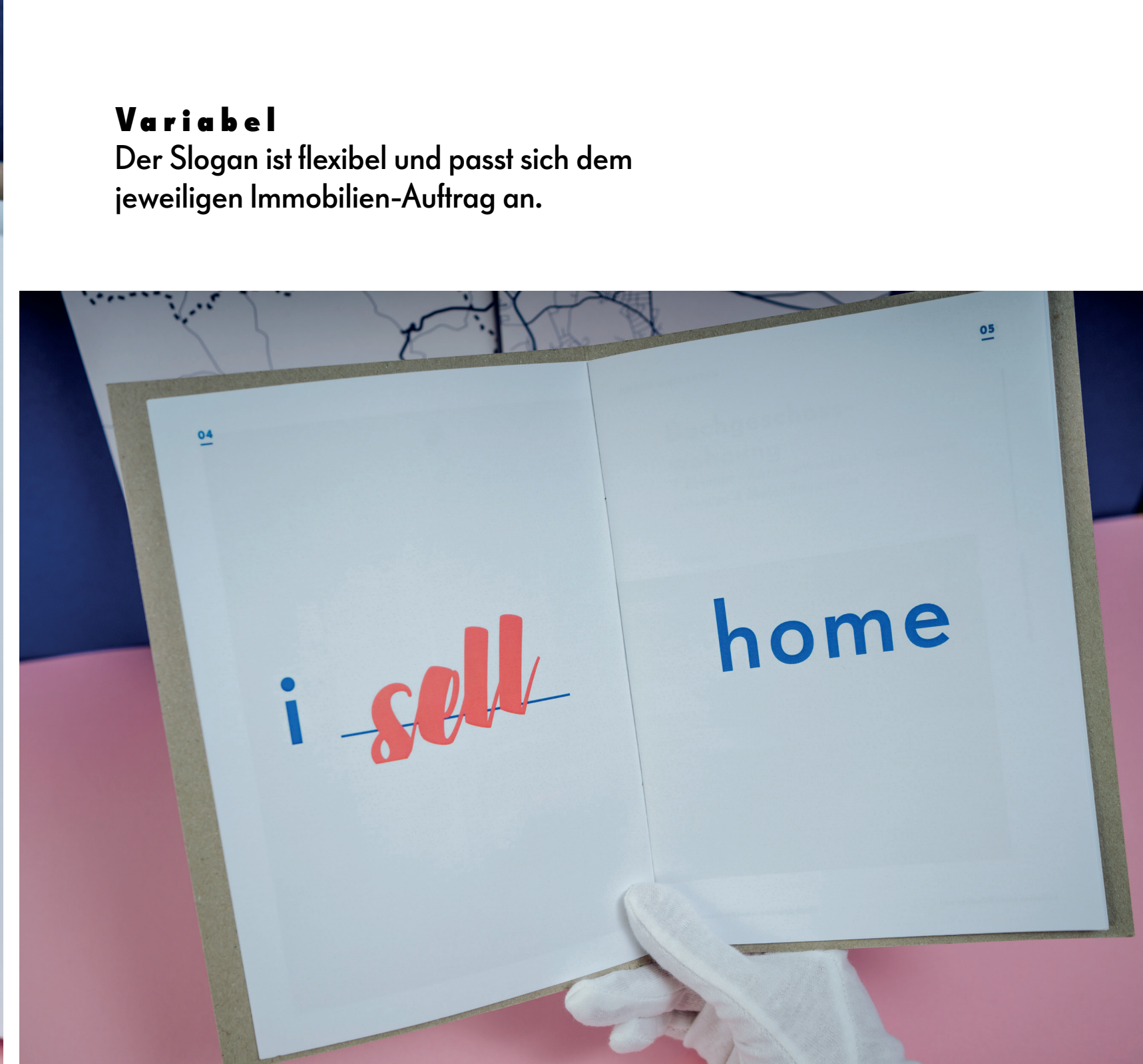
Variabel Der Slogan ist flexibel und passt sich dem jeweiligen Immobilien-Auftrag an.