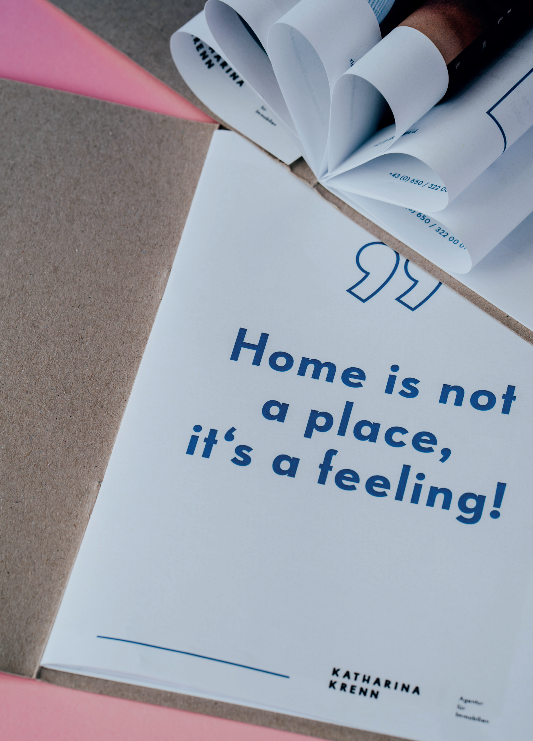
Individuell Exposé mit individuellem Innenleben.