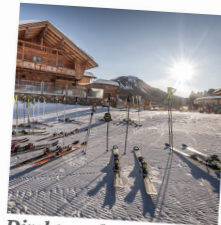
Direkt an der Piste K-Hotel, K-Alm & K-Stadl