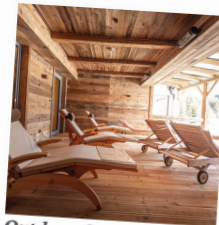
Outdoor-Spa Sauna und überdachte Frischluftarea