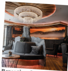
Rezeption & Lobby Herzlich willkommen!

Hotel Kornock • Familie Strablegg 8864 Turracher Höhe 120, Austria Tel: +43 4275 8228 • E-Mail: kornock@hotel.at Web: www.kornock.at