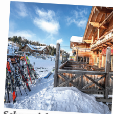
Schneesicher Die Piste und das Auto!