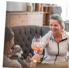
Zur Ruhe kommen Zeit fürs Wesentliche