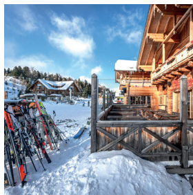
Schneesicher Die Piste und das Auto!