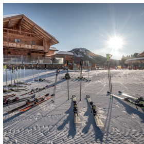
Direkt an der Piste K-Hotel, K-Alm & K-Stadl