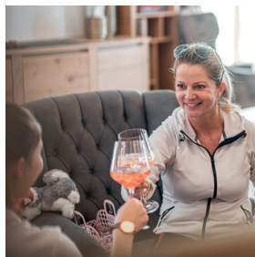
Zur Ruhe kommen Zeit fürs Wesentliche