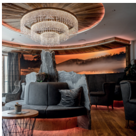
Rezeption & Lobby Herzlich willkommen!

Impressum: Hotel Kornock GmbH, Familie Strablegg, 8864 Turracher Höhe 120, www.kornock.at Rechtsform: GmbH, Gerichtsstand: Murau. Konzeption und Gestaltung: Ing. Mag. Jeanette Vallant, www.diekreatur.at, Fotos: © Die Abbilderei - Die Abbilderei, Dieter Sajovic & Jana Scherr. © Alexander Müller, © Adobe Stock. Die Angaben entsprechen dem Stand Mai 2021.