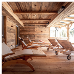
Outdoor-Spa Sauna und überdachte Frischluftarea